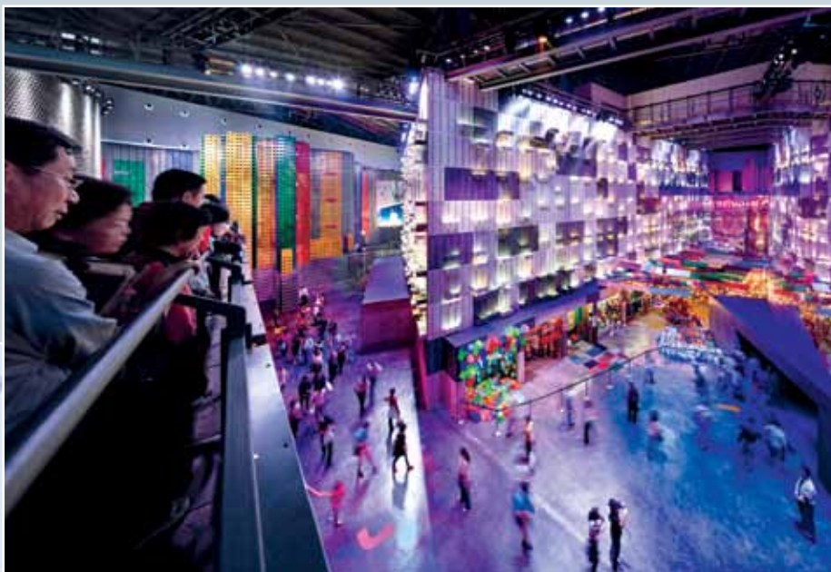
Schema voor beheerste publieksstromen in een paviljoen op de Wereldtentoonstelling in Shanghai.

bij drukte – voortschuifelen tussen sturende obstakels: tourniquets, kaartjesmachines, maar ook tussen attracties als bars en winkels of noodzakelijke faciliteiten: toilet, bagagekluisen, liften, trappen.