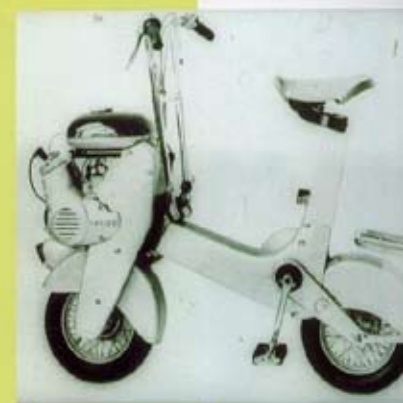
Wim Gilles, 'Scooterette', 1961-63 Joseph Beuys, 'Grond', 1981, gemengde techniek, 225 x 1200 x 350 cm

De tentoonstelling presenteert circa 25 hoogtepunten uit de geschiedenis van de industriële vormgeving, van 1855 tot nu. De expositie is te zien in de grote Bodonzaal.