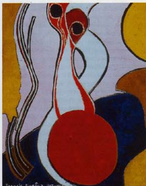
Francis Picabia, 'Danger de la Force', 1947-50, olieverf op doek, 120 x 96 cm

Het ontstaan der dingen plaats Museum Boijmans Van Beuningen, Rotterdam van 10 mei t/m 27 juli