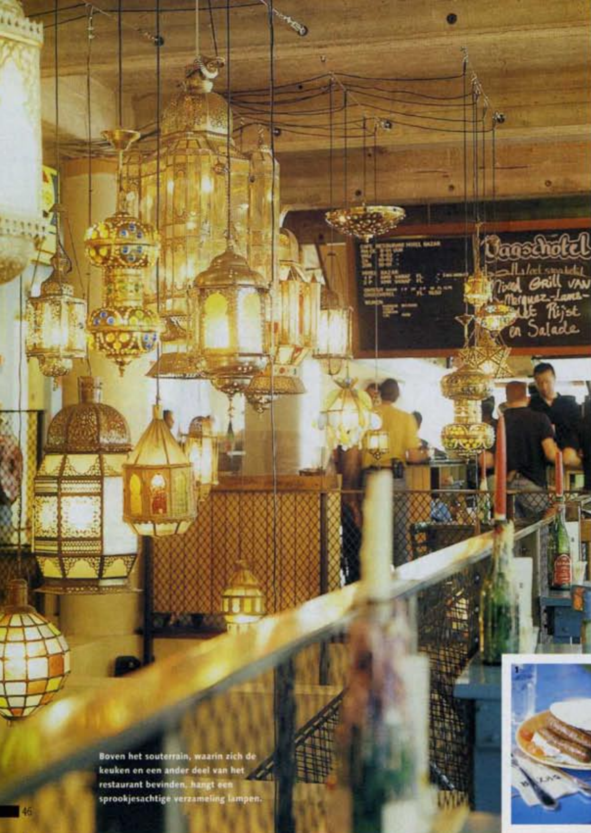
Boven het souterrain, waarin zich de keuken en een ander deel van het restaurant bevinden, hangt een sprookjesachtige verzameling lampen.