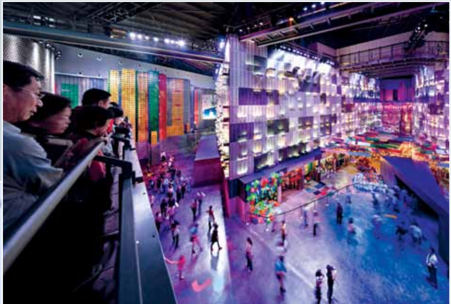
Schema voor beheerste publieksstromen in een paviljoen op de Wereldtentoonstelling in Shanghai.

bij drukte – voortschuifelen tussen sturende obstakels: tourniquets, kaartjesmachines, maar ook tussen attracties als bars en winkels of noodzakelijke faciliteiten: toilet, bagagekluisen, liften, trappen.