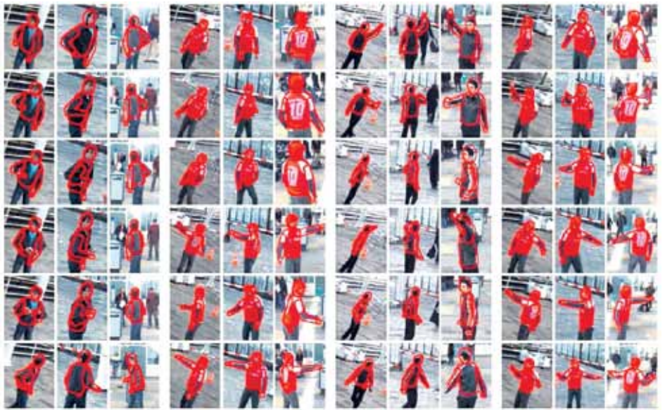
De computer herkent via camerabeelden afwijkende lichaamshoudingen door omtrekken van torso, hoofd en ledematen te vergelijken.

Idealiter moet een bewegend menselijk silhouet als observatie-object op een zwarte achtergrond overblijven. Nog mooier is wanneer de camera software zelf de wandelaar traceert in plaats van hem uit te selecteren. Dat kan door de computer te laten rekenen met kleurwaarden van de pixels, hun samenhang met buurpixels en de plaats in het beeld. Clusters van pixels worden dan herkend als huidskleur en gezichtskenmerken. Is de persoon eenmaal goed in beeld dan plakt