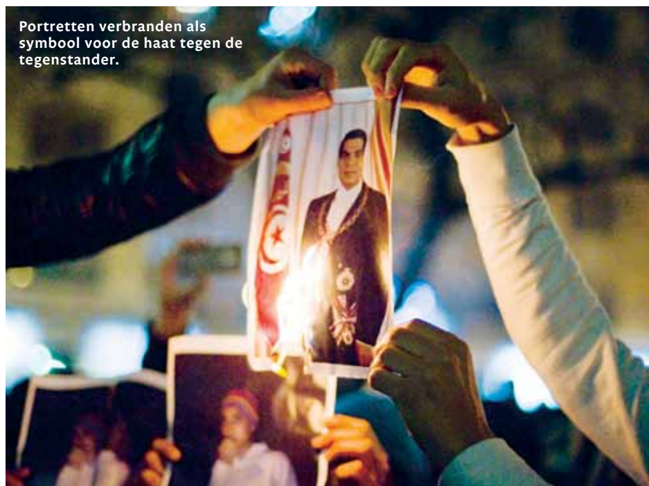
Portretten verbranden als symbool voor de haat tegen de tegenstander.

De Universiteit van Amsterdam werkt nu met twee stereocamera's die ruimtelijker - dus herkenbaarder - mensenmassa's kunnen analyseren. Voordeel van deze virtuele beeld-