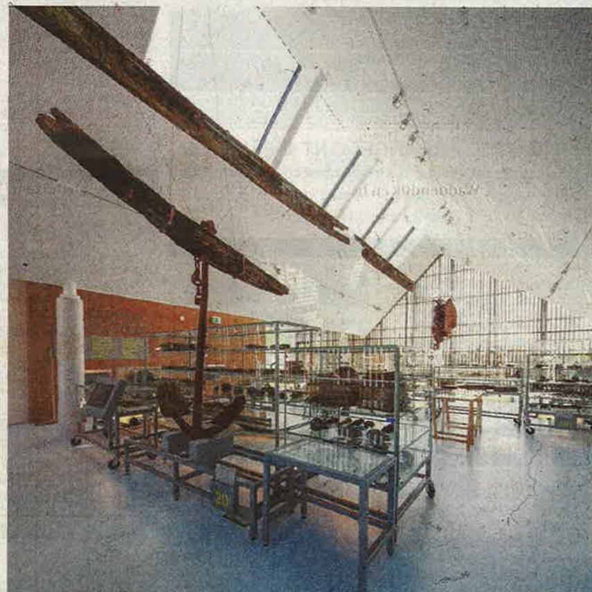
Veel archeologisch materiaal is naar boven gehaald door amateur-duikers.