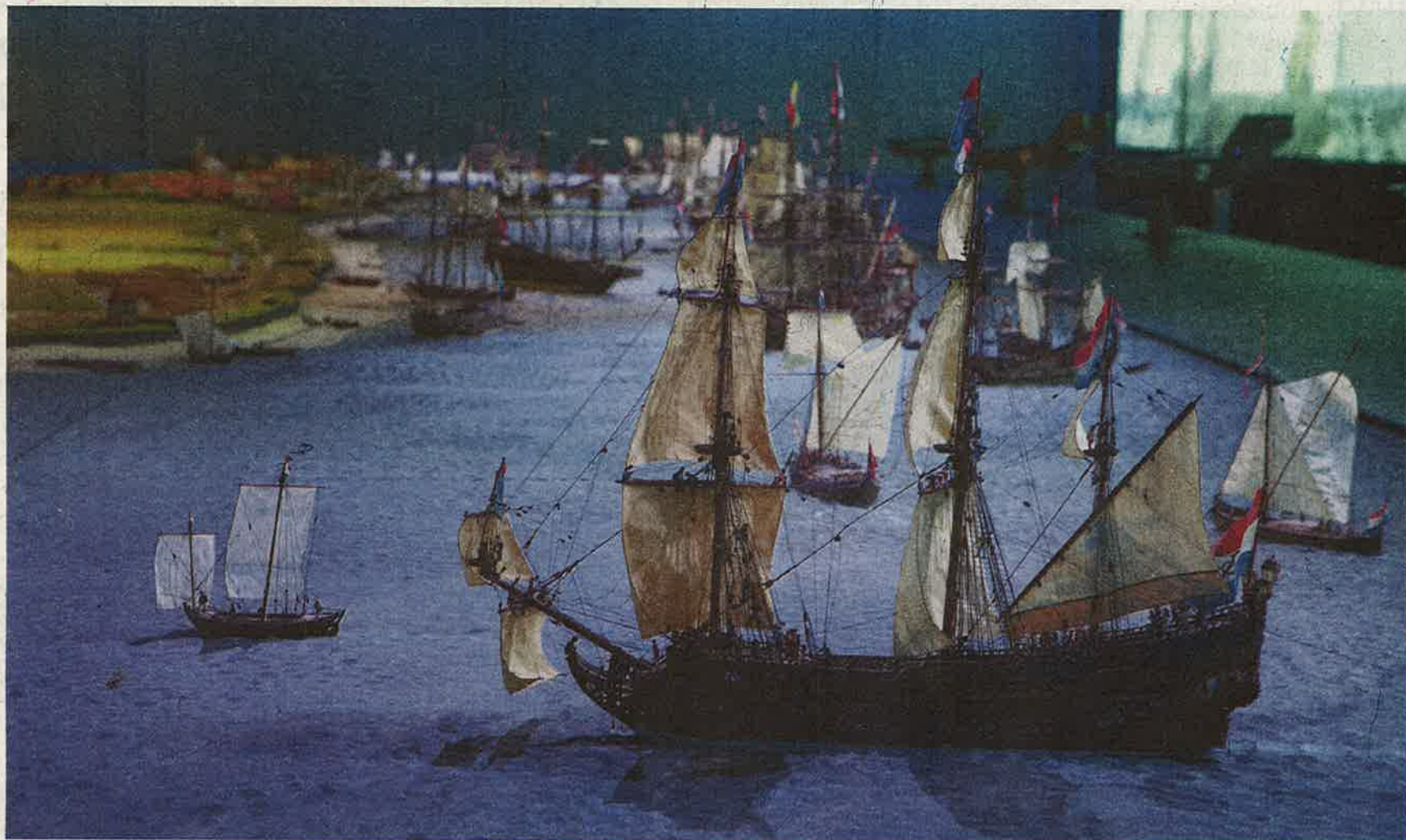
De maquette De Reede van Texel heeft een plek gekregen in de kelder van het museum Kaap Skil.

De bescheiden omvang van de huizen in het wijkje illustreert dat Oudeschild nooit de allure bereikte die de Zuiderzeebases van de VOC wel bezaten. Historicus Hans Bonke schreef in het boek Texel en de VOC (2002) dat de compagnie maar een uiterst beschei-