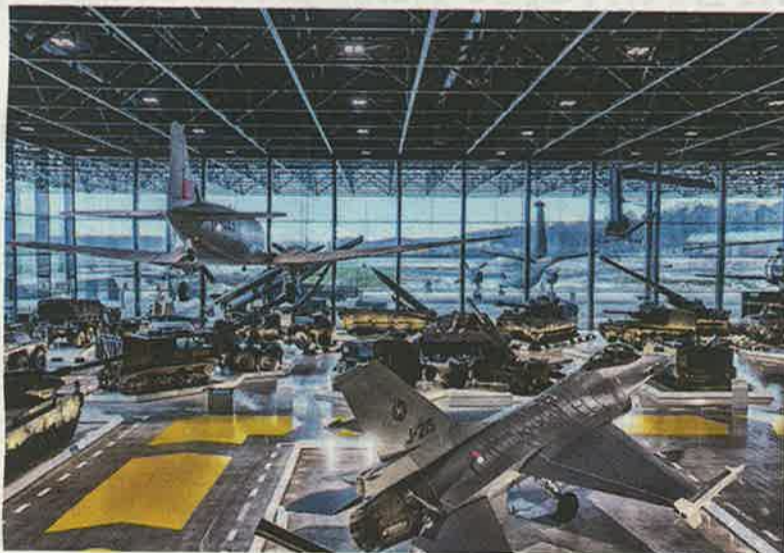
Door het ontbreken van kolommen kan de ruimte optimaal worden benut.