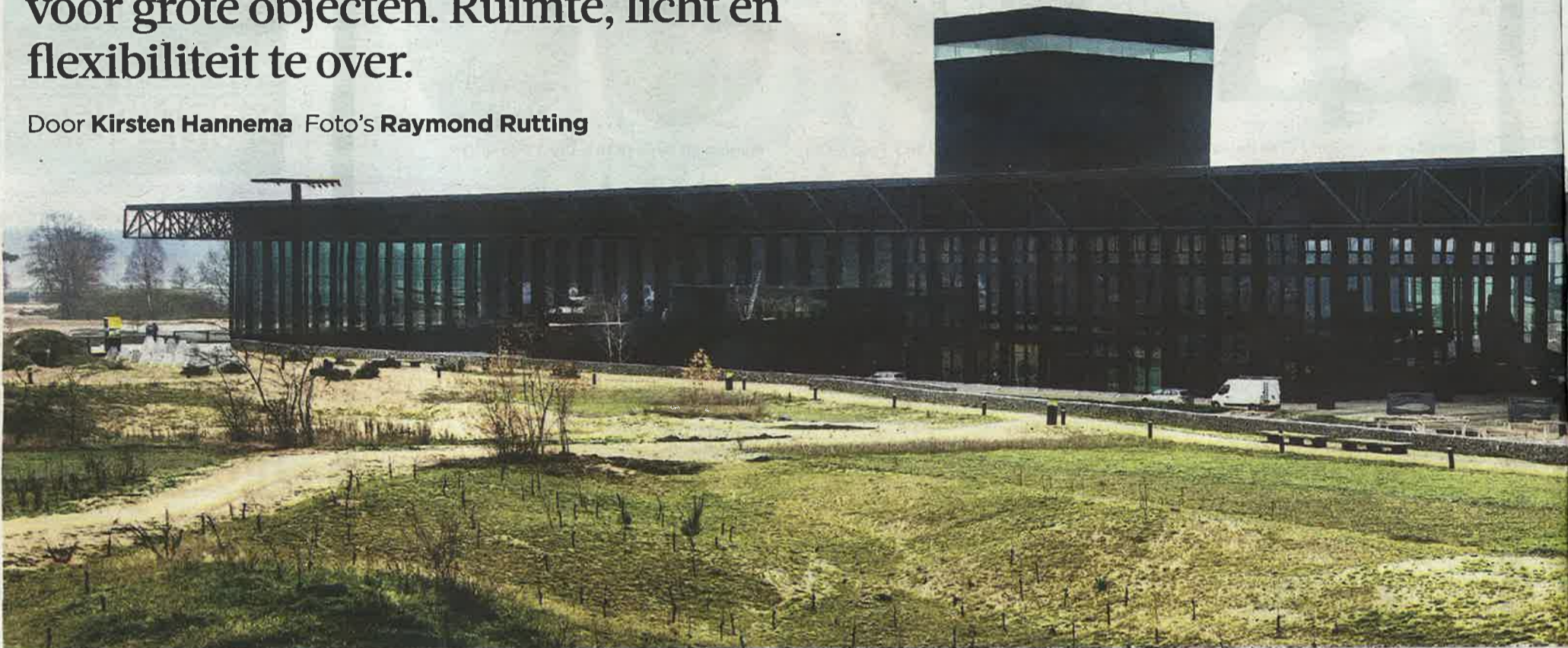
Overzicht van het nieuwe Nationaal Militair Museum op de voormalige luchtmachtbasis in Soesterberg. Binnen maximale transparantie en ruimte, buiten een overdekte expositiegelegenheid.

Door Kirsten Hannema