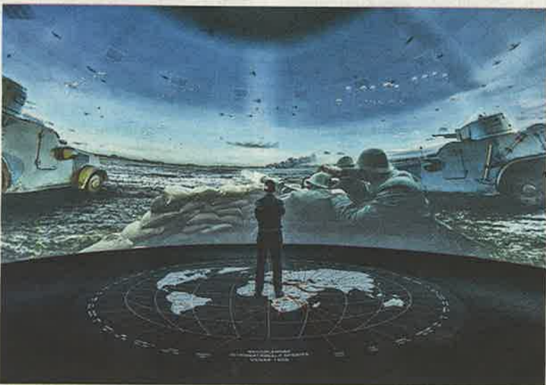
Opstelling met projectie rondom in het Nationaal Militair Museum.

ontwerpen in de 'wilde' jaren negentig in de architectuur op de achtergrond zijn geraakt. Van de gridstructuur, die tot in de plafondplaten van de wc's is doorgevoerd, tot de brandslanghaspels, die in hetzelfde zwartbruin als dak en wanden zijn geschilderd: alles klopt. De meeste bezoekers zal het wellicht niet opvallen, maar je voelt het.