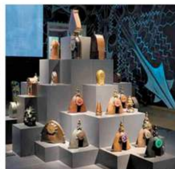
De tentoonstelling opent met een toren van bijzondere klokken. Bovenaan prijkt de klok 'op schaatsjes' van De Klerk.