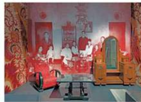
De Indische cultuur inspireerde ook de Amsterdamse Scholers.

Kramer ontworpen luxe warenhuis geldt als een hoogtepunt van de stroming. Maar het wordt ook wel haar zwanenzang genoemd. Want niet lang daarna zou de strakke vormgeving van De Stijl en het Functionalisme de architectuur in Nederland gaan domineren. In de huidige tentoonstelling is een kleine zaal geheel gewijd aan het bijzondere winkelinterieur.