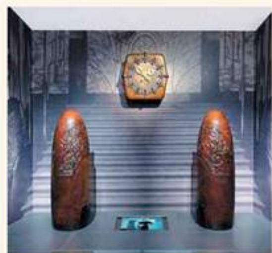
De klok en de rijkversierde houten trapbeddingen van de Haagse Bijenkorf.