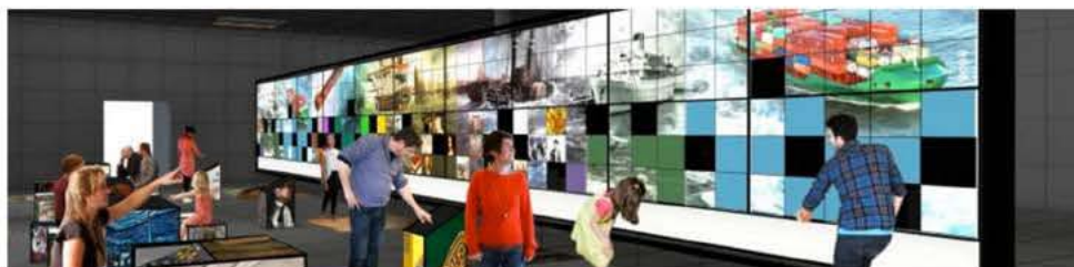
Artist impression van het nieuwe museum