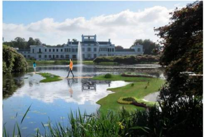
Made by Holland: water in de proeftuin: de Artificiële Archipels in de Hofvijver

- Made by Holland. Dit plan maakt een podium voor de innovatiekracht van Nederland. Het park wordt een proeftuin waar innovatie zichtbaar en beleefbaar wordt. In de Proeftuin vormen historische gebouwtjes als het sportpaviljoen, het speelhuisje, de watertoren, het chalet en de ijskelder en een aantal nieuwe tijdelijke follies interactieve onderdelen van het plan. Het paleis biedt ruimte aan tentoonstellingen. In de vleugels kunnen bedrijven en kennisorganisaties ruimte huren om hun nieuwste innovaties te presenteren. Aan de overkant van de Amsterdamsestraatweg is ruimte voor ontvangsten en evenementen. Er is horeca (ook hotels) op verschillende plekken op het landgoed. Op het terrein van de voormalige marechausseekazerne komen 65 (half)vrijstaande woningen. Initiatiefnemers: Hylkema Consultants B.V., MeyerBergman Investments, Beheer- en Exploitatiemaatschappij Westergasfabriek en Leeuwenpoort Ontwikkeling.