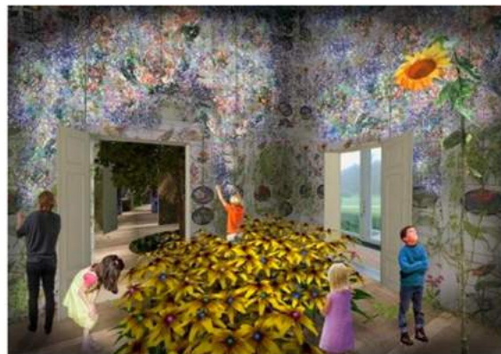
Exposities in paleiskamer (Kossmann.dejong)

Icoon van Eden Soestdijk wordt een architectonische kas die door het bos achter in de paleistuin slingert. In de imposante kas leren bezoekers op een interactieve wandeling door spectaculaire landschappen over circulariteit, ecologisch evenwicht maar ook over de sociale aspecten van duurzaamheid. In het tropisch regenwoud ervaar je het belang van biodiversiteit. Het efficiënt en duurzaam produceren van voedsel staat centraal in het hightech agrarisch gebied. In een ondergrondse wereld zie je hoe schimmels en bacteriën functioneren. De gevolgen van klimaatverandering worden zichtbaar in een ijzig poollandschap en het unieke Marslandschap benadrukt de kwetsbaarheid van de aarde vanuit kosmisch perspectief.