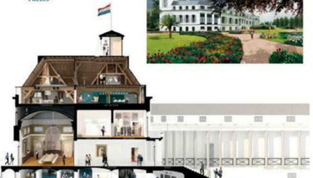
Nationaal Ensemble. Impressies van de doorsnede van Paleis Soestdijk met museale, bezoekers- en werkruimten (onder) en de paleistuin rondom het paleis (rechtsboven).