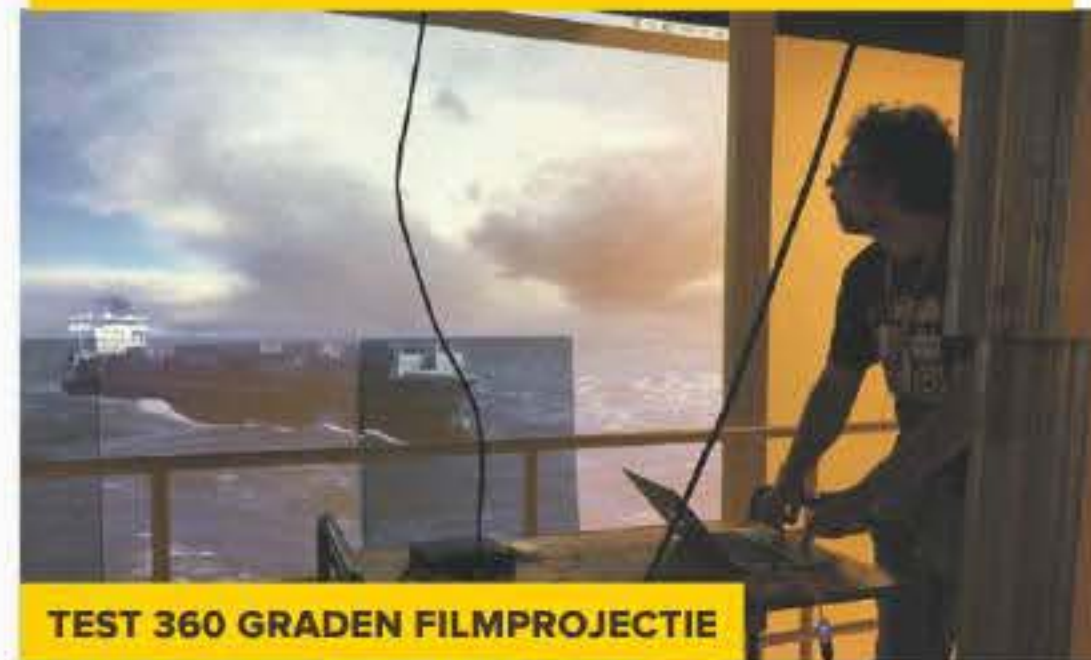
TEST 360 GRADEN FILMPROJECTIE

Nooit eerder maakten de projectleiders een tentoonstelling over een onderwerp dat zo midden in de actualiteit staat. "Na het klimaatakkoord van Parijs over het terugdringen van broeikasgassen hebben we het ontwerp van de tentoonstelling uiteraard aangepast. Daar kun je niet omheen als je het hele verhaal van de offshore-industrie wilt vertellen. Een verhaal dat interessant is voor zowel de industrie als de bezoekers."