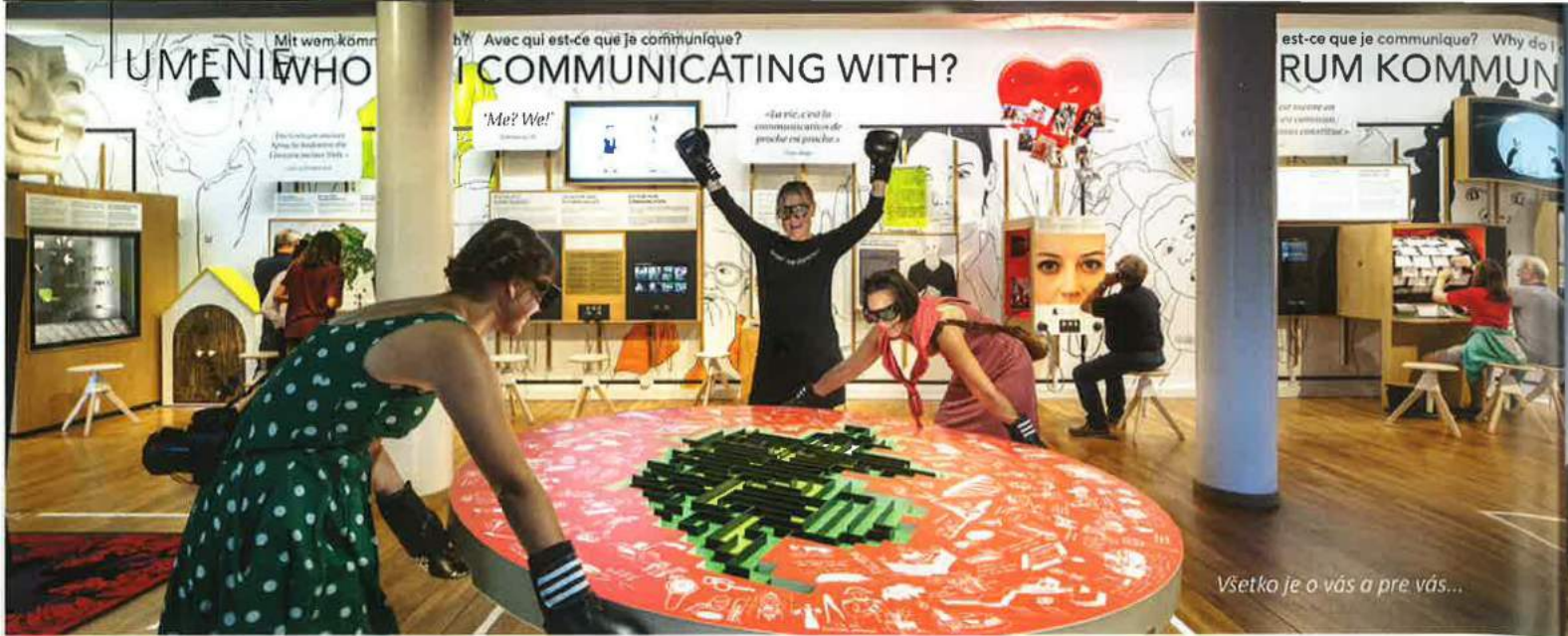
Všetko je o vás a pre vás...

V jednej z miestností s veľkou stenovou projekciou zase máte možnosť skúmať vplyv počítačových sietí a etické otázky o hodnote a zjavne nekonečnej dostupnosti ukladania dát.