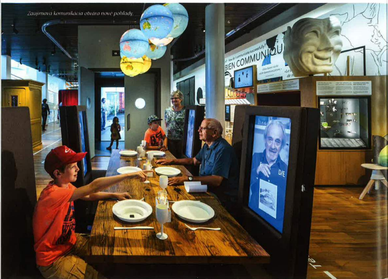
Zaujímavá komunikácia otvára nové pohľady.